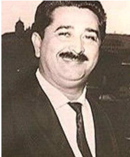
José Pedro de Freitas (Zé Arigó)